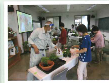
講習会（中級者向け寄せ植え） 参加者38名