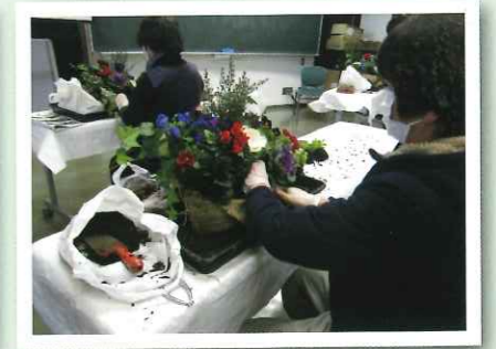
講習会（クリスマス） 参加者12名