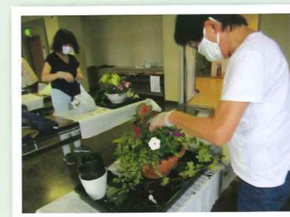
講習会（初級者向け寄せ植え） 参加者14名

自宅で過ごす時間が多くなる中で、みどりを楽しむことが心と体の健康に大きく寄与すると考えられます。長岡京市緑の協会では、今後もできる限り、みどりを楽しむ普及事業を展開していきます。